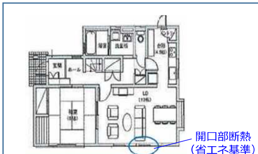
住宅の一部の断熱改修イメージ図 (①-イの基準に適合)

太陽光発電設備、太陽熱利用設備、高断熱浴槽、高効率給湯機、またはコージェネレーション設備の いずれかの 設備を設置する工事