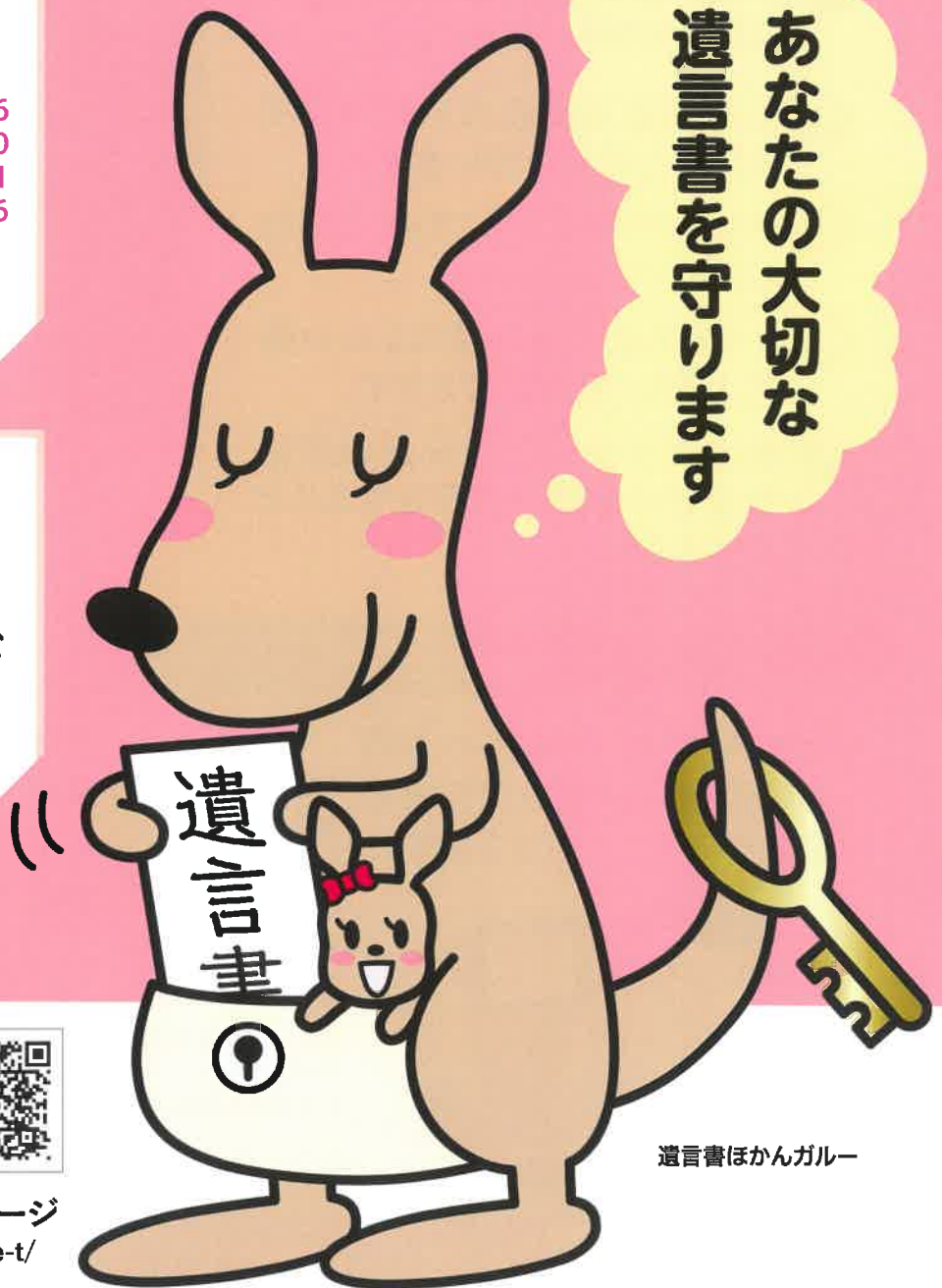
遺言書ほかんガルー